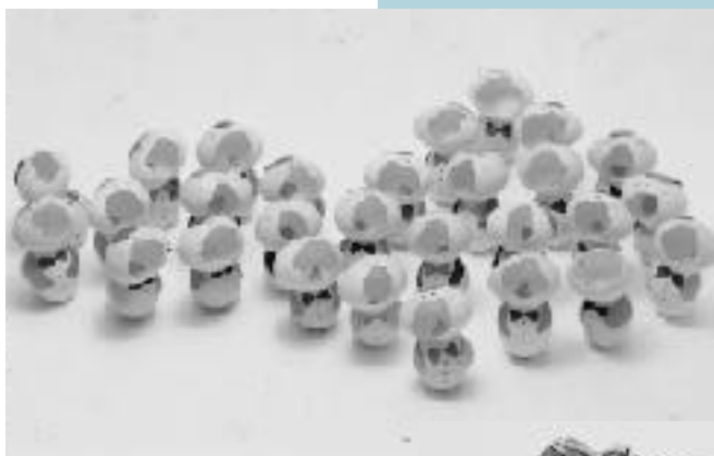
卵の殻を使った人形