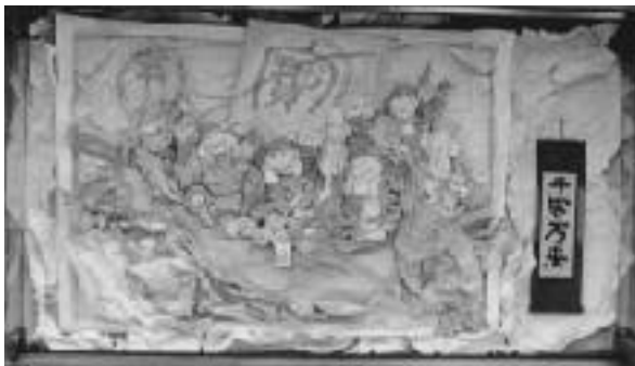
国民生活金融公庫のウィンドーディスプレイ