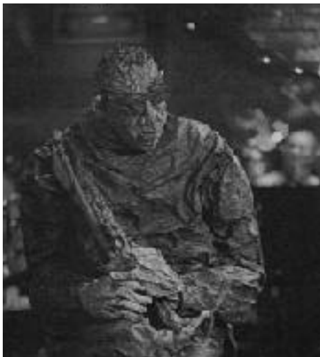
等身大 ジャズメンオブジェ