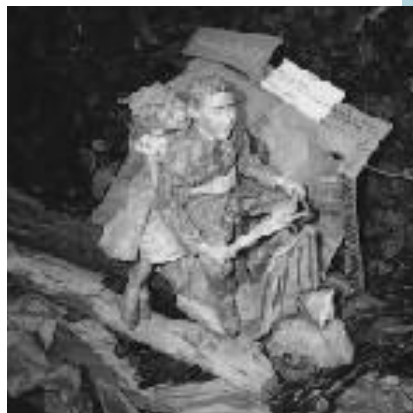
ベスバは作りたかった