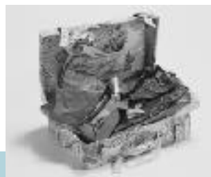
ニューズペーパークラフト