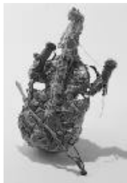
カニの甲羅のオブジェ