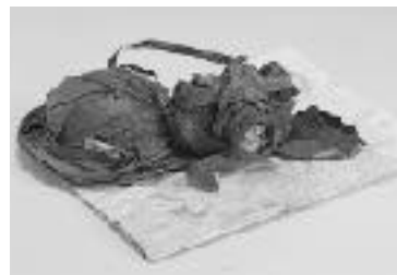
トチの葉で作ったミニプラト