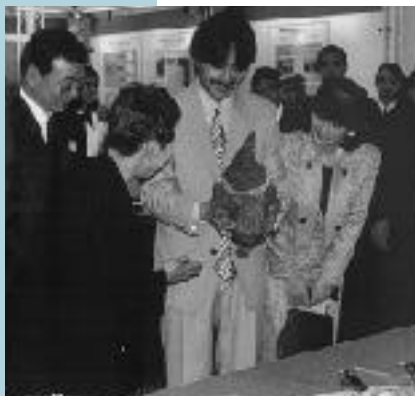
環境庁主催エコリサイクルフェアにて