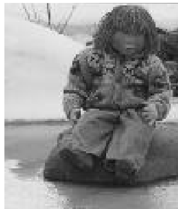
人形に洋服を着せて