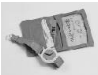
米袋染色加工のペーパークラフト