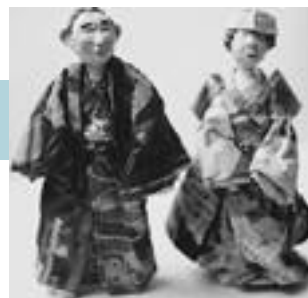
地酒を持ってお嫁入り