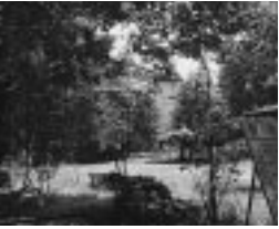
元鍛冶公園 住居標示変更前はこの公園が面している通りが元鍛冶町。仙台城下が作られたとき鍛冶町が置かれ、後に北・南鍛冶町ができたため元鍛冶町となった

定禅寺通櫓丁 定禅寺通りに面した国分町通りより西側。江戸時代前半に北櫓丁と定禅寺通りが繋がったため、二つの名前がくっついた。