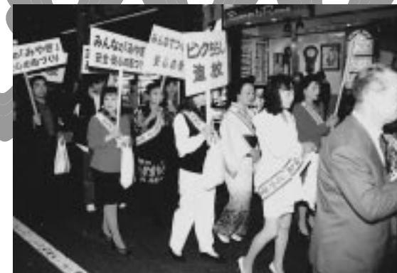
ママさんたちもパレードに参加