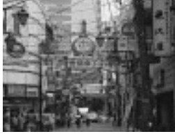
虎屋横丁 藩政時代この付近にあった薬屋が虎屋と称し、店頭には虎の彫刻を飾っていたことから付いた名。トラになるまで飲みたくなる意味も(?)

定禅寺通櫓丁 定禅寺通りに面した国分町通りより西側。江戸時代前半に北櫓丁と定禅寺通りが繋がったため、二つの名前がくっついた。