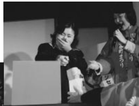
何枚つかめたかな？手が小さい人は損。500円玉つかみどり