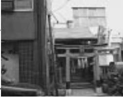
豊川稲荷 稲荷小路の名前のもとになった神社