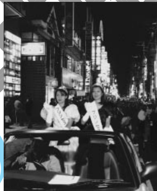
ミス国分町パレード